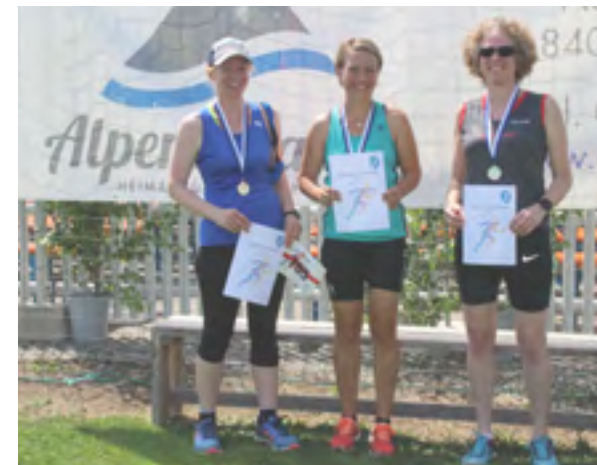
6 km Frauen