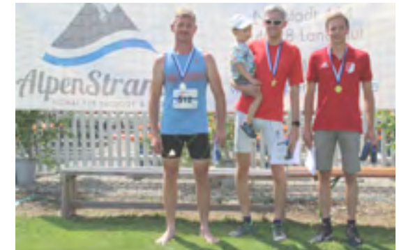
10 km Herren